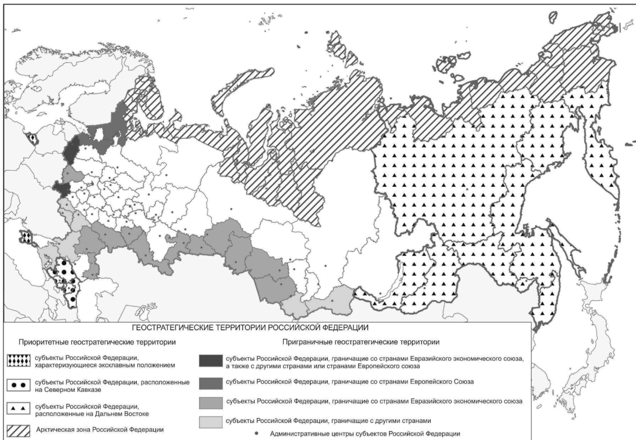
Схема размещения геостратегических территорий Российской Федерации

Информация об изменениях: Приложение 5 изменено с 25 июня 2022 г. - Распоряжение Правительства России от 25 июня 2022 г. N 1704-Р См. предыдущую редакцию